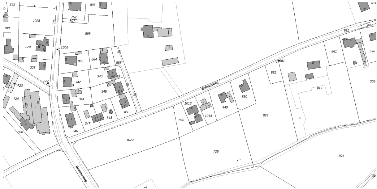
Königberger Straße/Zollhausweg (Geoportal NRW)